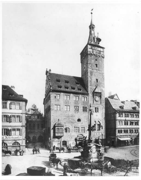
Abb. 1 Südwestansicht des Grafeneckartbaues in der Zeit um 1900.