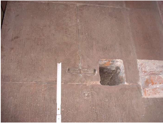
Abb. 6 Bauzeitlicher Fensterverschluss in der Südwand c_1 des Wenzelsaales [+1.2.]. Die Wandöffnung in der Laibung von F 1 geht 1,80 m tief in das Mauerwerk und diente einst zur Aufnahme eines die Fensteröffnung blockierenden Holzbalkens; die Wandaussparung findet in der gegenüberliegenden Laibung eine nur acht Zentimeter tiefe Entsprechung. Der kleine Treibriegel diente nach Vorschieben des Balkens als Sicherung gegen das Zurückschieben des Holzes in die Mauernische.