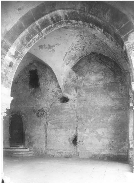
Abb. 7 Ostwand b des Wenzelsaales [+1.2.] in der Zeit um 1915. An den Baunähten gut zu erkennen ist die spitzbogige Öffnung zur Turmstube sowie die noch im Wandabschnitt b_1 über T 2 erkennbare Wandöffnung mit steil angeschrägtem Sohlbankbereich.